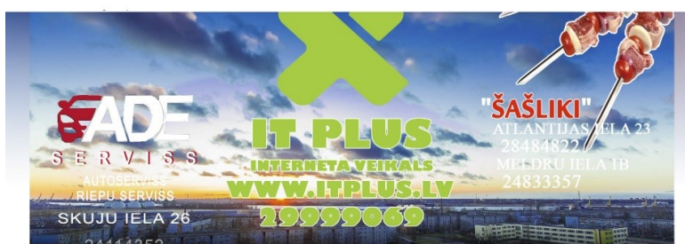
Vecmīlgravis ● Public group · 15,6 tūkst. members

Daugavgrīvas/Bolderājas un Vecmīlgrāvja Facebook grupu titulattēli (skat. 2021.05.19.). Daugavgrīva / Bolderāja / Усть-Двинск / Болдерая ( https://www.facebook.com/groups/dvinskcity ) "Vecmīlgravis" ( https://www.facebook.com/groups/vecmilgravis )